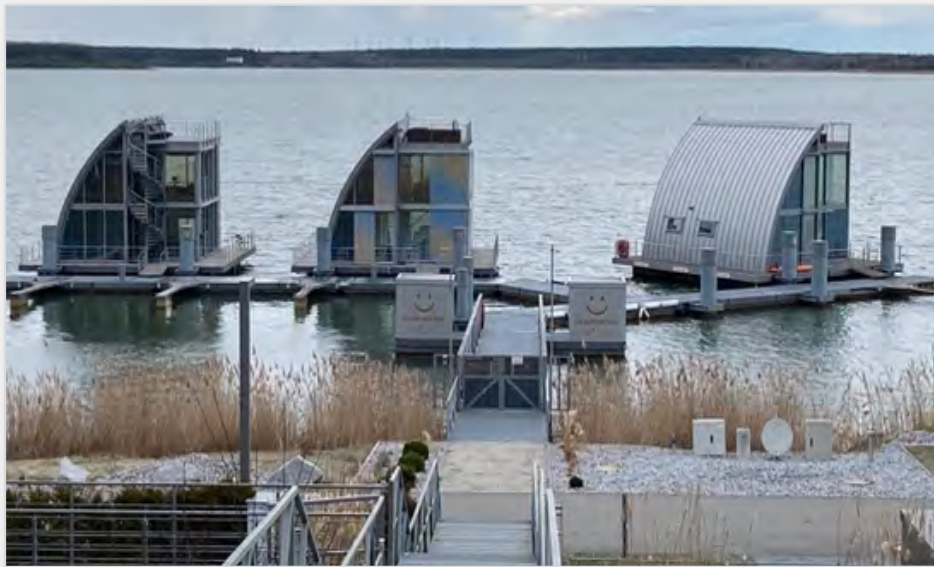
Abbildung 30: Schwimmende Häuser in der Lausitz.

Der Hersteller Floating Homes realisierte am Viktoriakai in Hamburg , unweit der Hafencity, eine Anlage mit sieben schwimmenden Wohnhäusern, die mit sämtlichen Ver- und Entsorgungsleitungen an das städtische Netz angeschlossen wurden. Beheizt werden sie mit Wärmepumpen. Sie haben eine Wohnfläche von 160 Quadratmetern und verfügen über ein zusätzliches großes Skydeck. Infos: www.floatinghomes.de