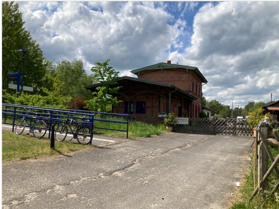
Abbildung 9: Der Bahnhof Ruhlsdorf-Zerpenschleuse liegt nahe am Finowkanal.

Das bestehende Angebot bietet nur eingeschränkte Möglichkeiten, um One-Way-Touren auf dem Wasser bei Rückfahrt mit öffentlichen Verkehrsmitteln zu organisieren. Möglich wäre das zum einen auf dem Abschnitt zwischen den Schleusen Schöpfurth und Stadthafen Eberswalde unter Nutzung des Angebots an Stadtbussen, zum anderen auf der OHW zwischen den Schiffshebewerken Niederfinow und Oderberg unter Nutzung der Buslinie 916. Die Schaffung einer Anlegestelle in Niederfinow würde zudem One-Way-Touren ab Eberswalde bei Rückfahrt mit Bus oder Bahn möglich machen.