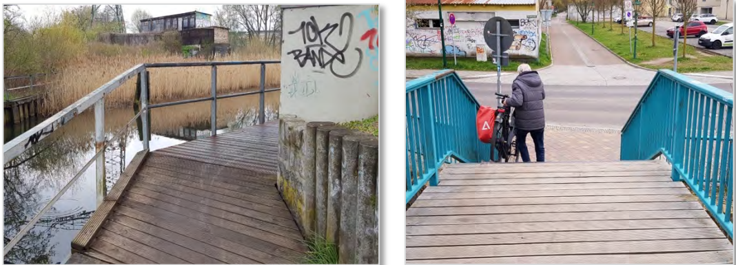
Abbildung 6.1,2: Gefahrenstelle Brücke Erna-Bürger-Weg (l.), nicht barrierefreier Zugang Stadtschleuse (r).