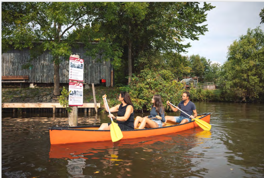
Abbildung 13: History-Trail in Stade.

www.stade-tourismus.de/entdecken-und-erleben/aktiv-und-sportlich/wassersport/paddeltrails/