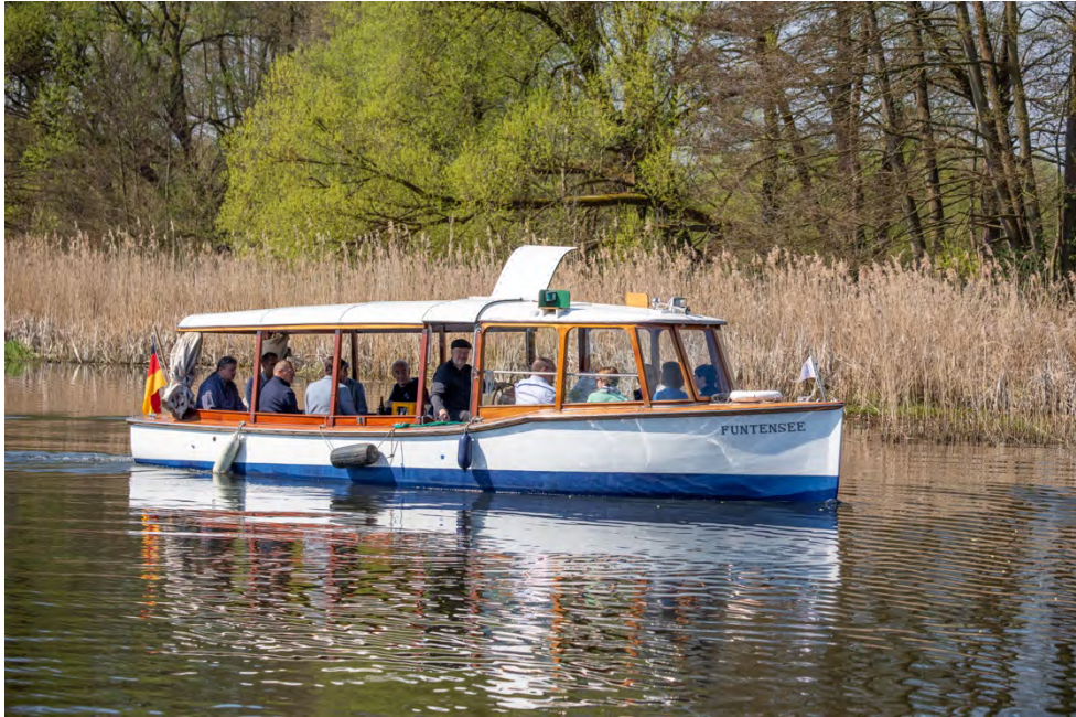
Abbildung 22: Die Funtensee unterwegs auf dem Finowkanal.

Am Finowkanal soll das vom Verein „Unser Finowkanal“ betriebene Salonboot Funtensee wieder einen klimafreundlichen elektrischen Antrieb erhalten. Das Boot fuhr ab 1919 bereits am Königsee mit einem leisen Elektromotor, der allerdings später durch einen Dieselmotor ausgetauscht wurde. Für die erneute klimafreundliche Umrüstung werden derzeit die technischen Möglichkeiten und Kosten geklärt.