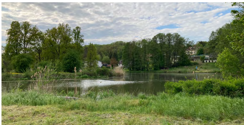
Abbildung 21: Sonnenuntergangsplatz an der Wriezener Alten Oder in Oderberg.