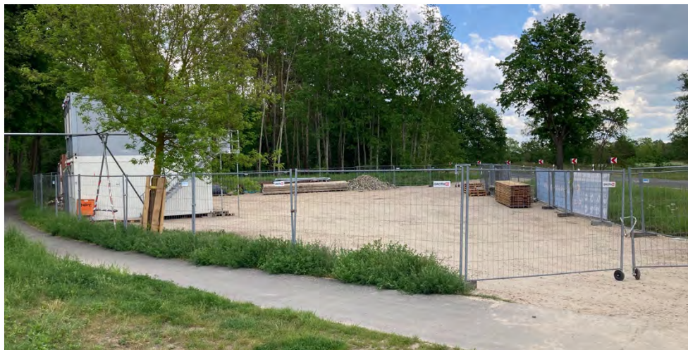
Abbildung 24: Mögliche Parkfläche an der Schleuse Ruhlsdorf.

Der ZRF plant im Rahmen der Schleusensanierung die Anlage eines öffentlichen Parkplatzes sowie die Schaffung weiterer touristischer Angebote auf dem Areal. So entsteht dort ein attraktiver Verknüpfungspunkt, der mit dem MIV, mit dem ÖV und per Rad gut erreichbar ist und die Möglichkeit bietet, dort ein eigenes Paddelboot zu Wasser zu lassen oder ggf. auch ein Boot zu mieten. Die Maßnahme wird detailliert in Kapitel 6 beschrieben.