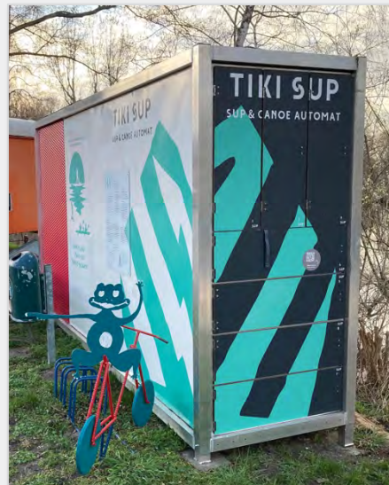
Abbildung 15: SUP- und Kanu-Box.

Das Unternehmen Heiuki (eh. Tiki) bietet Vermiet-Boxen für SUPs. Diese Boxen sind auch an zahlreichen Standorten im Land Brandenburg im Einsatz. Die Nutzung ist einfach: Man bucht online den gewünschten Standort und Termin. Danach erhält man eine Buchungsnummer per Mail, mit der ein Fach in der Box geöffnet werden kann. Die Preise variieren je nach Standort und Saison und beginnen bei zehn Euro pro Stunde. Die Automaten bieten je nach Größe Platz für sieben oder 14 SUPs und können mit einer Pkw und Anhänger transportiert werden. Das Unternehmen bietet verschiedene Partnerschaftsmodelle – vom Standortpartner, der eine kleine Umsatzbeteiligung erhält über Franchise-Partner, die die Investitionskosten tragen und einen größeren Anteil am Umsatz erhalten, bis zur White-Label-Lizenz, bei der der Partner unter eigener Marke arbeitet. Infos: www.heiuki.com