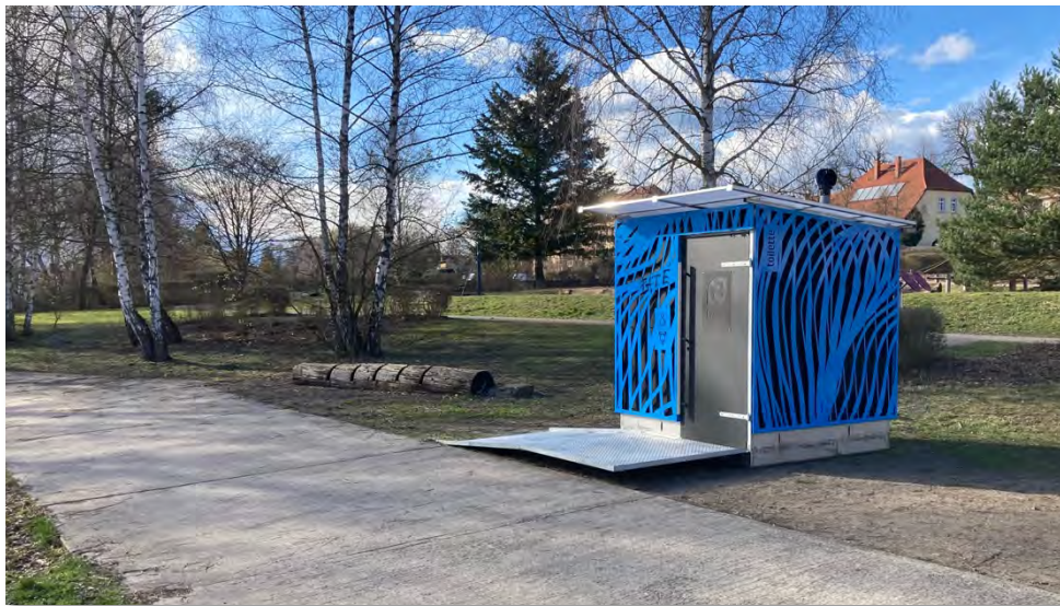
Abbildung 27: Barrierefreie Trockentoilette am Standort Messingwerkhafen.

Im gesamten Verlauf der Treidelwege bzw. des Oder-Havel-Radwegs gibt es nur sehr wenige Toiletten. Das führt dazu, dass Nutzende nicht nur in der Natur, sondern auch in Ortslagen ihre Notdurft im Freien verrichten. Aus Sicht der Projektbearbeitenden sollte sichergestellt werden, dass in regelmäßigen Abständen entweder öffentliche Toiletten vorhanden sind oder Toiletten in gastronomischen Betrieben und anderen Einrichtungen (gegen Gebühr) auch öffentlich genutzt werden können.