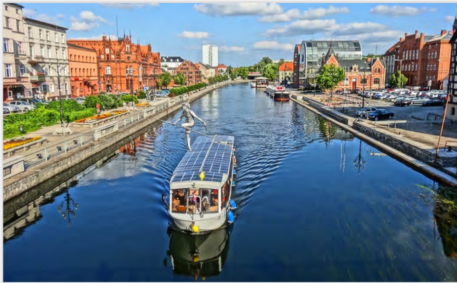
Abbildung 18: Wassertaxi Stonecznik in Bydgoszcz

In der polnischen Stadt Bydgoszcz (Bromberg) verkehrt schon seit 2008 als Wasser-Tram die Solarfähre Stonecznik mit Platz für 28 Personen. Entwickelt wurde das von zwei 10-kW-Motoren angetriebene Schiff von einer Firma aus Velten. Inzwischen wird auch ein Schwesterschiff als Wasser-Tram eingesetzt. Die Schiffe verkehren in der Sommersaison täglich nach festem Fahrplan auf zwei Routen im Stadtzentrum rund um die Mühleninsel und auf dem Bromberger Kanal. Die Fahrten dauern jeweils etwa 60 Minuten. Im Jahr 2022 zählten die Wasser-Trams rund 27.000 Gäste. Tickets kosten 20 Złoty, umgerechnet gut vier Euro. Das Angebot wird von der Stadt Bydgoszcz betrieben und über das touristische Portal vermarktet. Online-Buchungen sind auf der (polnischsprachigen) Website möglich. Infos unter www.visitbydgoszcz.pl