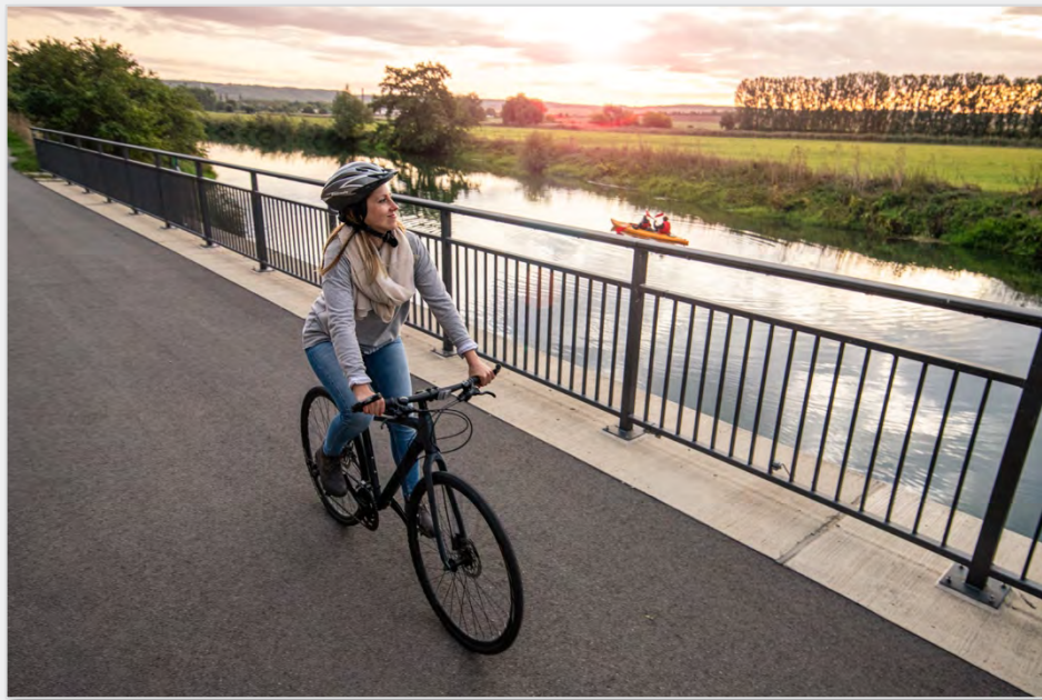
Abbildung 14: Kanu und Rad an der Saale.

Auffallend ist, dass die One-Way-Angebote hier kein Nischenprodukt wie in vielen anderen Regionen sind, sondern das Hauptgeschäft aller Anbieter darstellen. Die Preise für Tagestouren mit Personentransport im Pkw liegen zwischen 25 und 35 € pro Person und sind damit deutlich höher als der durchschnittliche Mietpreis für ein Kanu pro Tag (2er Kanu Tagesmiete ca. 30-40 €).