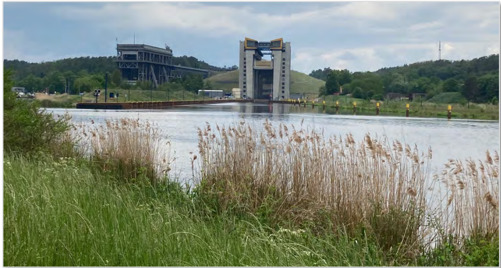
Abbildung 8: Schiffshebwerke in Niederfinow.