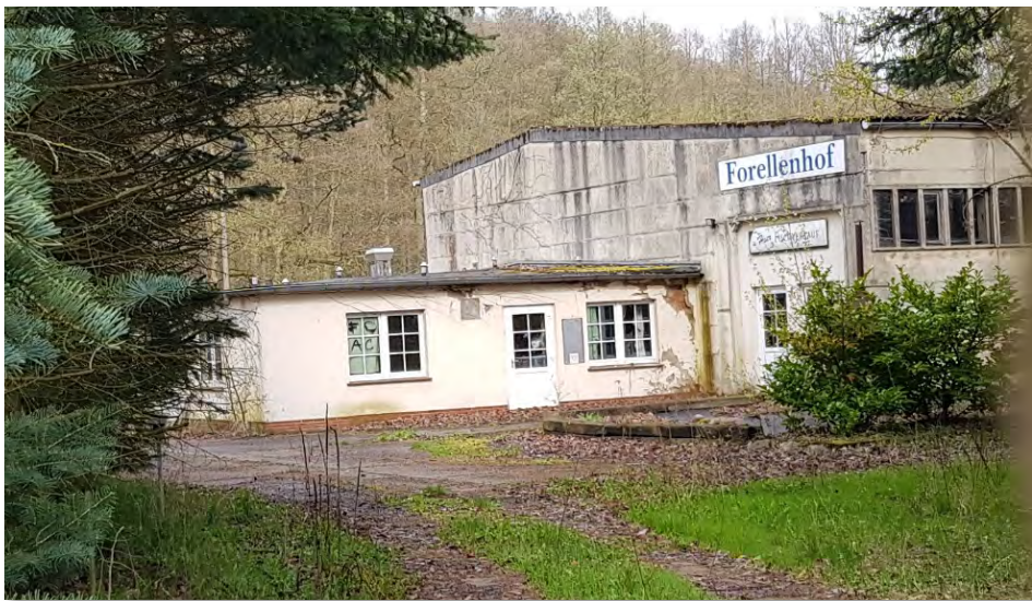
Abbildung 29: Leerstehendes Ausflugslokal "Forellenhof" an der Ragöser Schleuse.

Inwieweit bei geplanten Investitionsvorhaben an ehemaligen Industriestandorten in Eberswalde wie im Bereich der Messingwerksiedlung Ost, der Hufnagelfabrik und des Alten Schlachthofs auch gastronomische Nutzungen geplant werden, konnte im Rahmen des Projekts ebenfalls nicht geklärt werden.