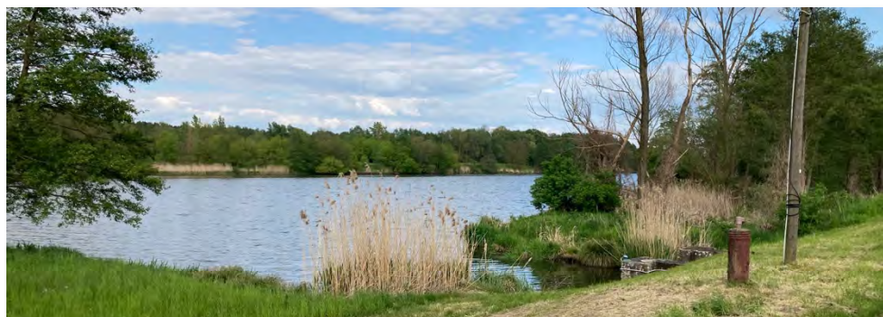
Abbildung 10: Naturlandschaft an der Alten Oder.

Insbesondere die westlich gelegenen Kommunen Wandlitz, Schorfheide und Biesenthal-Barnim verzeichneten in den vergangenen Jahren eine wachsende touristische Beanspruchung ihrer Seengebiete, sodass dort die touristischen Entwicklungspotenziale weitgehend ausgeschöpft sind. Für sie bieten sich entlang des Langen Trödels und Finowkanals Entwicklungsmöglichkeiten für einen sanften, naturnahen Tourismus. Gleiches gilt für die östlichen Abschnitte der Wasserstraße im Bereich des Amtes Britz-Chorin-Oderberg. Voraussetzung für eine touristische Entwicklung ist neben einer Verbesserung der (wasser-)touristischen Infrastruktur ein Ausbau der gastronomischen und der Übernachtungsangebote. Das betrifft neben den ländlichen Regionen auch und besonders die Kreisstadt Eberswalde als Ankerpunkt für die gesamte Region.