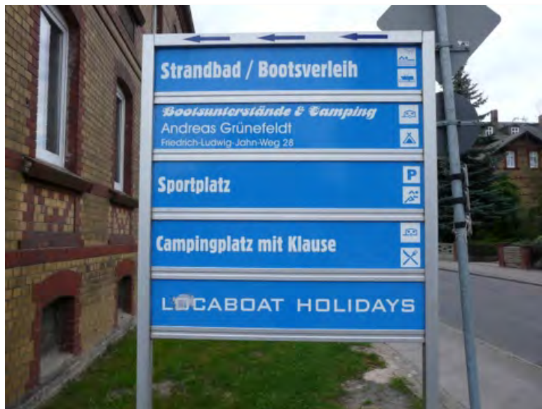
Abbildung 36: Beispiel für landseitiges Leitsystem.

Beim landseitigen Leitsystem geht es darum, wassertouristisch relevante Ziele innerhalb der Landwegweisung (Pkw, Fahrrad, Fußwege) auszuweisen, beispielsweise Charter- und Vermietstationen, Einsatzstellen für Kanus, Slipanlagen für Motorboote sowie Steganlagen, Uferpromenaden, Gastronomie am Wasser u.ä. Oft ist die Wegweisung ausschließlich auf landbezogene Aktivitäten begrenzt, Umstiegsstellen zwischen Land und Wasser werden wesentlich seltener in die Systeme mit aufgenommen.