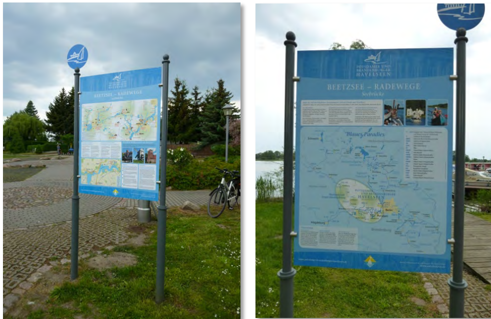
Abbildung 35 1., 2.: Infotafeln im Revier Havelseen.

Auf der Rückseite ist das gesamte vernetzte Binnenrevier Berlin-Brandenburg-Mecklenburgische Seenplatte dargestellt. Die Tafeln sind an rund 60 Standorten im Revier installiert.