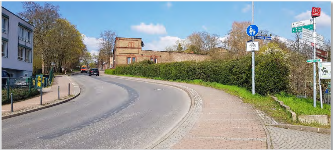
Abbildung 5: Fehlende Querungshilfe erschwert Übergang an Britzer Straße.