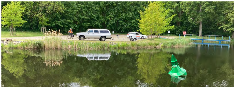
Abbildung 23: Slipanlage in Zerpenschleuse mit Parkmöglichkeit.

In Zerpenschleuse besteht temporär eine Überlastung der vorhandenen Parkflächen am Südufer des Langen Trödels. Dem will die Gemeinde Wandlitz mit der Schaffung eines zentralen Parkplatzes begegnen, allerdings steht hierfür bislang kein geeignetes Grundstück zur Verfügung. Da die angespannte Parksituation auch von Anwohnenden als problematisch angesehen wird und zu Akzeptanzproblemen für den Tourismus führen könnte, sollten diese Pläne mit Nachdruck weiterverfolgt werden.