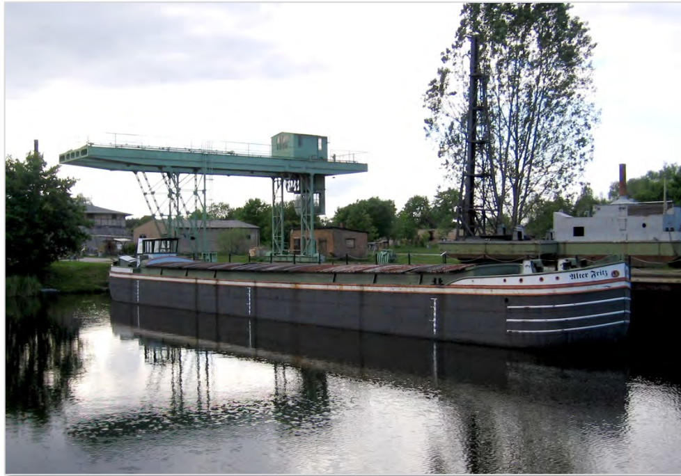
Abbildung 20: Finow-Maßkahn im Ziegeleihafen Mildenberg.

Vergangenheit bereits mehrfach Versuche unternommen, einen Finowmaßkahn zu erwerben und nach Eberswalde zu bringen, um ihn dort museal oder für Veranstaltungen zu nutzen. Diese Überlegungen sollten zur Attraktivitätssteigerung des Finowkanals wieder aufgegriffen werden. Je nach Zustand des Fahrzeugs kann das Schiff zu Lande oder auf dem Wasser einen festen Platz erhalten oder sogar auf dem Kanal verkehren. Eine vielfältige Nutzung für Ausstellungen, für Veranstaltungen oder als Restaurantschiff wäre denkbar. Um einen Finowmaßkahn zu erwerben und für neue Nutzungen herzurichten, ist auch eine breite Beteiligung der Öffentlichkeit denkbar. Über Crowdfunding und Sponsoring ließe sich ein Teil der benötigten Mittel einwerben.