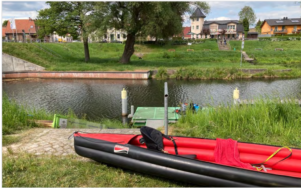
Abbildung 3: Umtrage- und Einsatzstelle in Finowfurt.