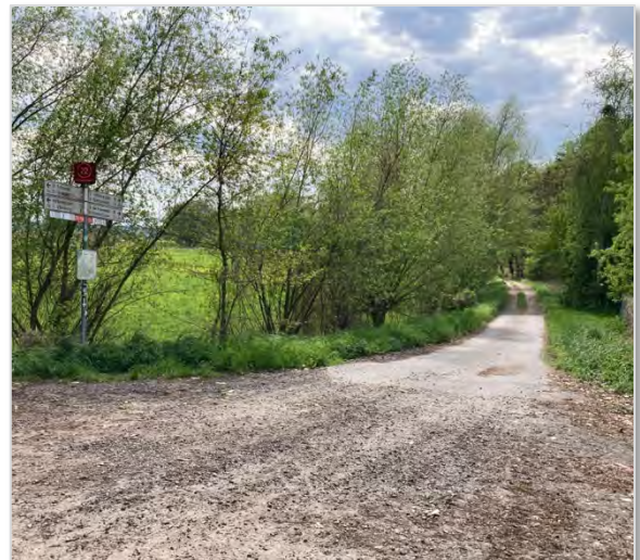
Abbildung 7.1, 2: Kopfsteinpflaster zwischen Oderberg und Hohensaaten (l.), Oder-Havel-Radweg zwischen Niederfinow und Bralitz (r).