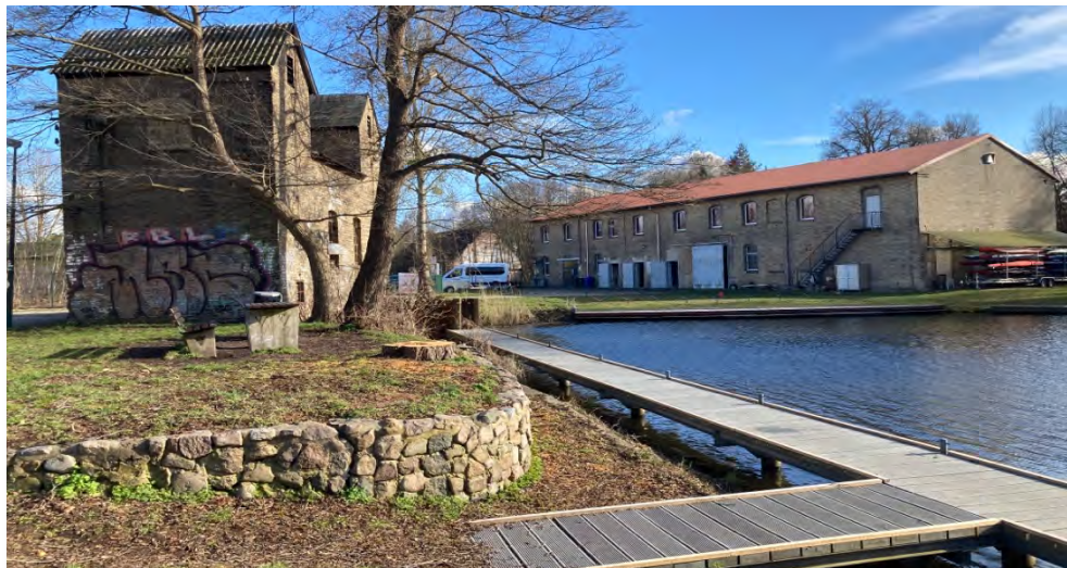
Abbildung 25: Anleger am Messingwerkhafen.

Der Wasserwanderrastplatz ist ein guter Standort, um bei einer Rast wichtige touristische Ziele in der Umgebung (Wasserturm, Kupferhäuser, Messingwerk-Siedlung) zu besichtigen. Der Standort ist gut mit MIV und ÖV zu erreichen. Aus Gutachtersicht sollte der Standort durch eine Erweiterung des touristischen Angebots (Gastronomie, Mietboote, Biwakplatz) ausgeweitet werden. Die Maßnahme wird detailliert in Kapitel 6 beschrieben.