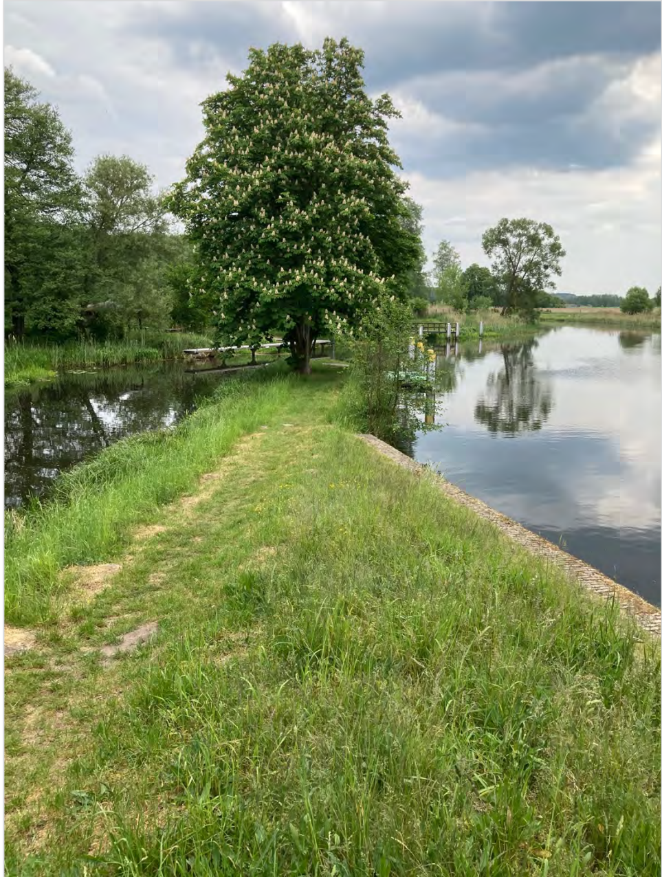
Abbildung 37: An der Ragöser Schleuse.

Seitens des ZRF sollte in Abstimmung mit Kommunen und touristischen Akteur:innen darüber diskutiert werden, ob und in welcher Form ein Nutzungsentgelt eingeführt werden kann.