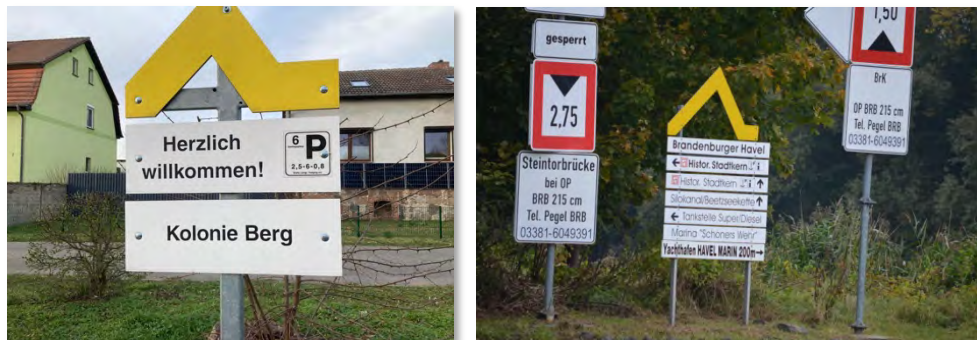
Abbildung 34.1,2: "Gelbe Welle" in Zerpenschleuse und Brandenburg (Havel).

Die bundesweit verbreitete, ehemals in Berlin-Köpenick entwickelte „Gelbe Welle“ stellt ein wasserseitiges Informationssystem da. Mit dem weit sichtbaren gelben Symbol soll Bootsfahrenden ein „Herzlich Willkommen“ signalisiert werden. Die Gelbe Welle ist in der Regel direkt vor oder an den Steganlagen angebracht und weist auf das Vorhandensein von Gastliegeplätzen hin. Sie kennzeichnet jedoch keine einzelne Liegeplätze, seitens der Skipper:innen ist beim weiteren Anfahren zu prüfen, wo angelegt werden kann. In der Gemeinde Schwielowsee und in Kloster Lehnin wird die Gelbe Welle auch zur Kennzeichnung von Kanu-Aussatzstellen genutzt. Darüber hinaus ist die Gelbe Welle auch als Willkommensschild an den wasserseitigen Eingängen innerhalb der Stadt Brandenburg an der Havel installiert. Die Gelbe Welle kommt zum Teil auch bereits in der Region Finowkanal zum Einsatz.