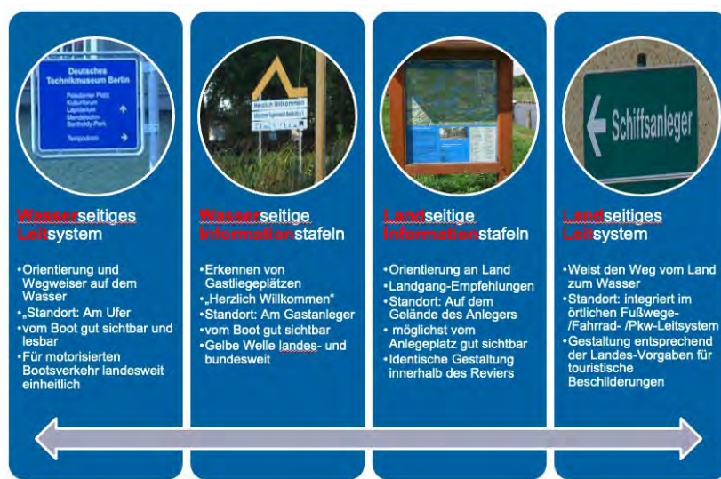
Abbildung 32: Übersicht Leitsysteme. Vorlage: Heike Helmers