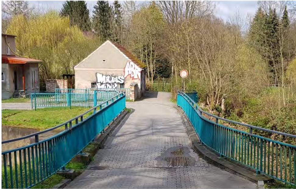
Abbildung 26: Durchfahrtsverbot an der Schleuse Kupferhammer aus südlicher Richtung.