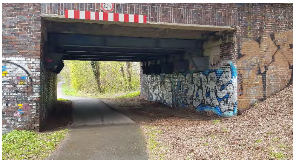
Abbildung 28: Brückenunterführungen (hier Marienbrücke in Finowfurt) können als wettergeschützte Rastplätze dienen.