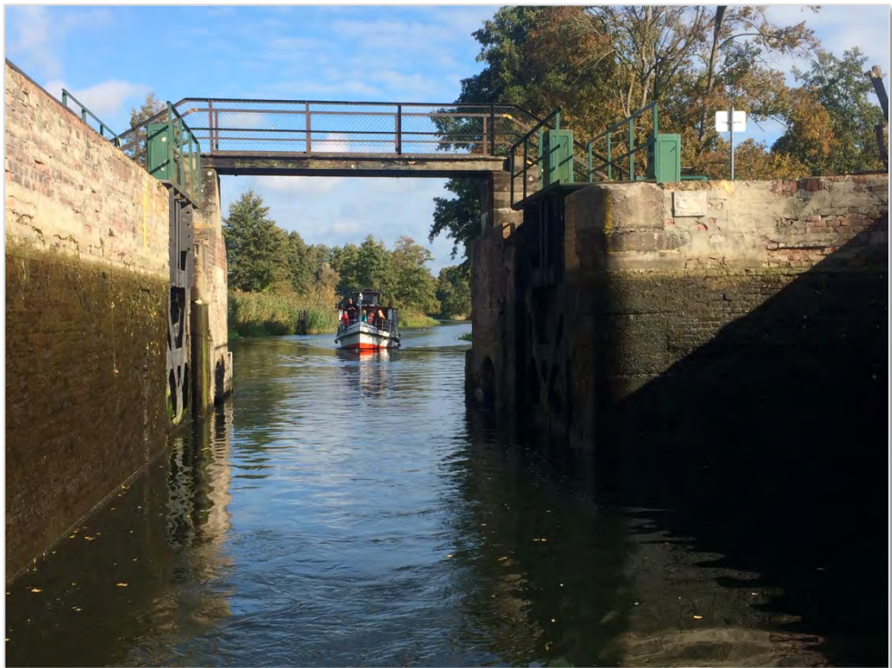
Abbildung 31: Unterwegs auf dem Finowkanal.

Seitens des ZRF sollten aus Sicht der Projektbearbeitenden die Möglichkeiten der Stromgewinnung an den Schleusen hinsichtlich ihrer Praktikabilität und des ökonomischen Nutzens geprüft werden. Zudem sollten die Anliegerkommunen die weiteren Vorschläge zur ökologischen Aufwertung der Uferbereiche prüfen.