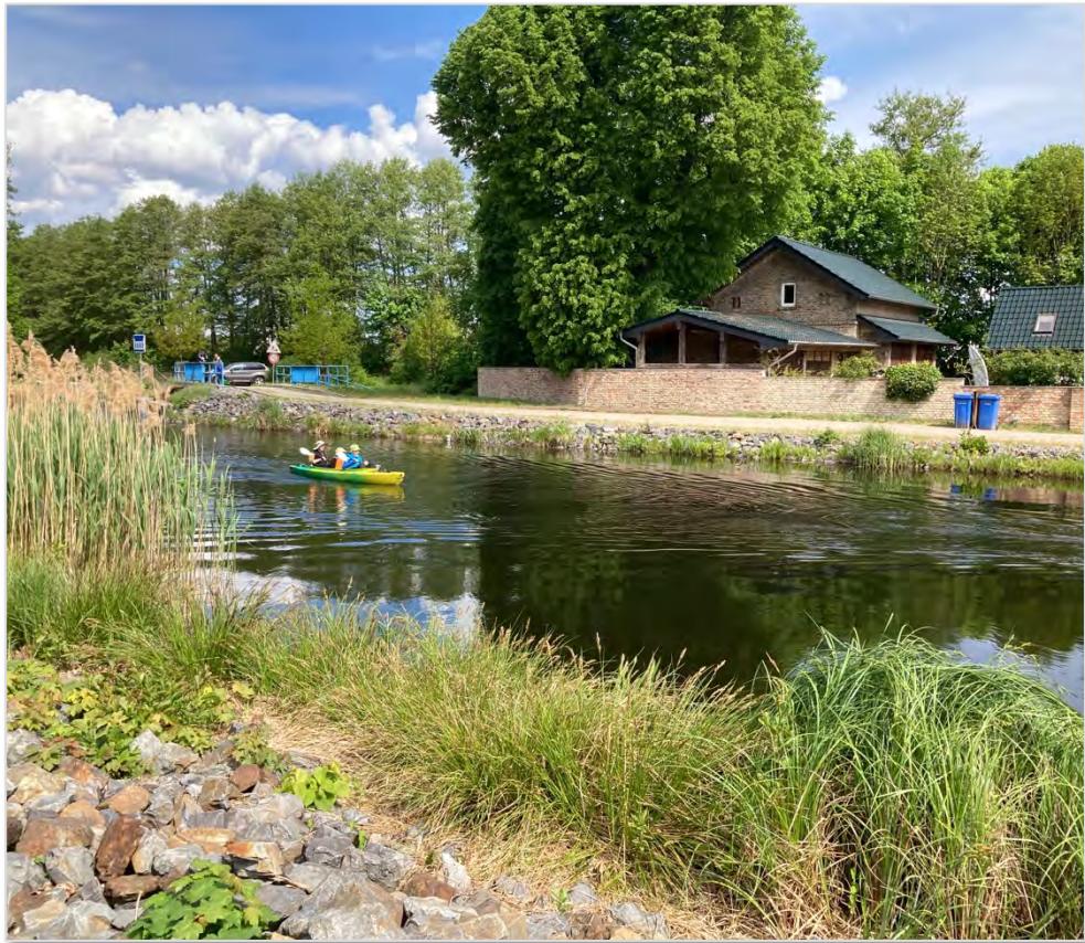
Abbildung 2: Paddelnde auf dem Langen Trödel.

Seitens des Landkreises wurde auf die Notwendigkeit hingewiesen, die Zeit der Baumaßnahmen an den Schleusen zu nutzen, um auch die übrige (wasser-)touristische Infrastruktur zu ertüchtigen. So soll zum Abschluss der Sanierung ein attraktives Gesamtangebot bestehen. Hierzu bedürfe es verbindlicher Absprachen der beteiligten Kommunen, Behörden und privaten Unternehmen. Zugleich wurde betont, dass die Zeit der Bauarbeiten keinen Stillstand in der touristischen Entwicklung und Vermarktung bedeute. Viele Angebote auf dem Wasser und am Wasser könnten auch in dieser Zeit aufrechterhalten oder neu entwickelt werden.