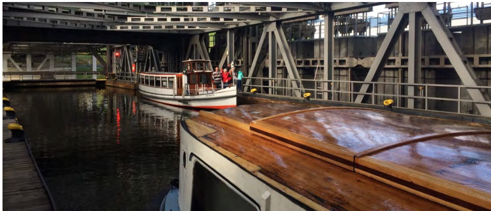
Abbildung 17: Ausflugsboote im alten Schiffshebewerk.

Gemessen an der Attraktivität der Wasserstraßen in der Region Finowkanal bleibt das Angebot an Schiffstouren auf dem Gewässer weit hinter den Möglichkeiten zurück. Eine Voraussetzung, um das Angebot zu stärken, ist die Sicherstellung der nötigen Mindestdiefe von 1,20 Metern. Für Schiffe, die auf mehrtägigen Touren unterwegs anlegen müssen, bedarf es eines Stromanschlusses, um die Anlagen an Bord über Nacht ohne Motorengeräusche betreiben zu können. Aus Sicht der Fahrgastunternehmen ist ein besonderes Erlebnis während der Fahrt die Schleusung von Hand. Durch die Automatisierung der Schleusen würde dieses wegfallen – es sollte aber die Möglichkeit genutzt werden, zumindest eine der Schleusen temporär von Hand zu bedienen, um so die Tradition zu wahren.