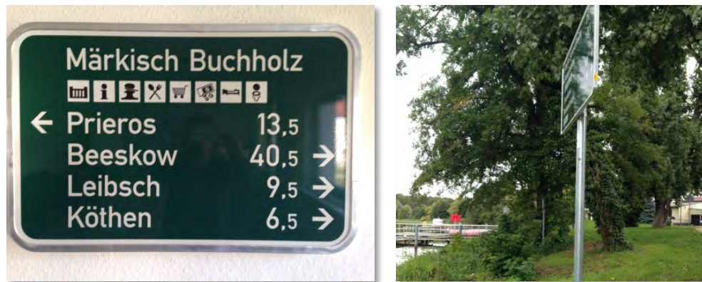
Abbildung 33.1.2: Beschilderungssystem der LAG Oderland.