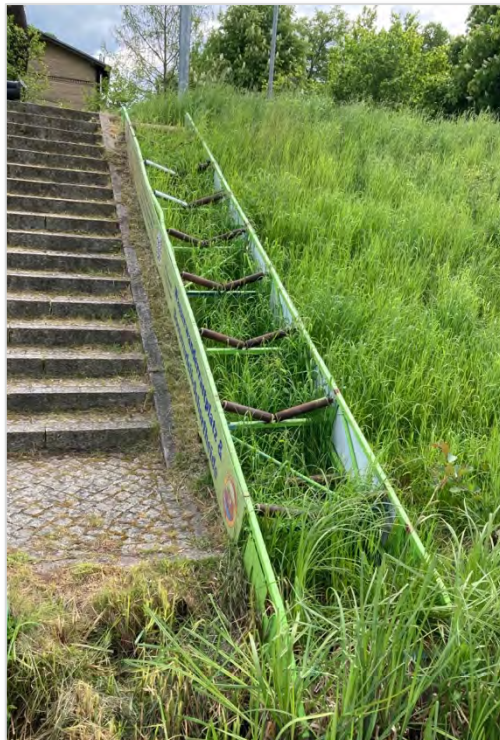
Abbildung 11: Beispiel für Bootsruksche an der Schleuse Schöpfurth.

15 Zentimeter soll ein bequemes Ein- und Aussteigen möglich sein. An der Schleuse Zerpenschleuse am langen Trödel ist das Umtragen bisher nicht möglich. Hier empfehlen wir, am nördlichen Ufer ebenfalls eine Umtragungsmöglichkeit zu schaffen.