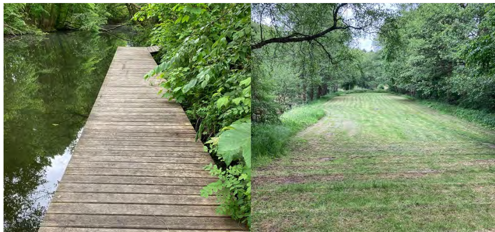
Abbildung 16: Anleger beim Familiengarten mit möglichem Biwakplatz.

Im gesamten Bereich der Region Finowkanal gibt es keine Bootstankstelle am Wasser. Der zentral gelegene Marienhafen nahe des Wasserkreuzes Havel-Oder-Kanal und Werbellinkanal bietet ein „Tanken unter Aufsicht“. Auf dem Areal gibt es zwei 300-Liter-Fässer für Diesel und Benzin, die nach Bedarf in einer nahegelegenen Tankstelle gefüllt werden. So ist für Boote immer genügend Treibstoff vorhanden. Dieser kann im abgesperrten Hafenbecken sicher abgefüllt werden; sollte dennoch Benzin ins Wasser gelangen, kann dort leicht eine Ölsperre errichtet werden. Aus Sicht des Betreibers kann hier der Bedarf der Bootsfahrenenden gedeckt werden; die Einrichtung einer Tankstelle im Bereich des Marienhafens erscheint ihm aufgrund der zu beachtenden Auflagen zu aufwendig und die Investition erscheint nicht rentabel. Ein ähnliches Angebot zum Tanken besteht auch bei der Marina Oderberg. Vom Anleger im Stadthafen Eberswalde ist eine Tankstelle fußläufig gut zu errei-