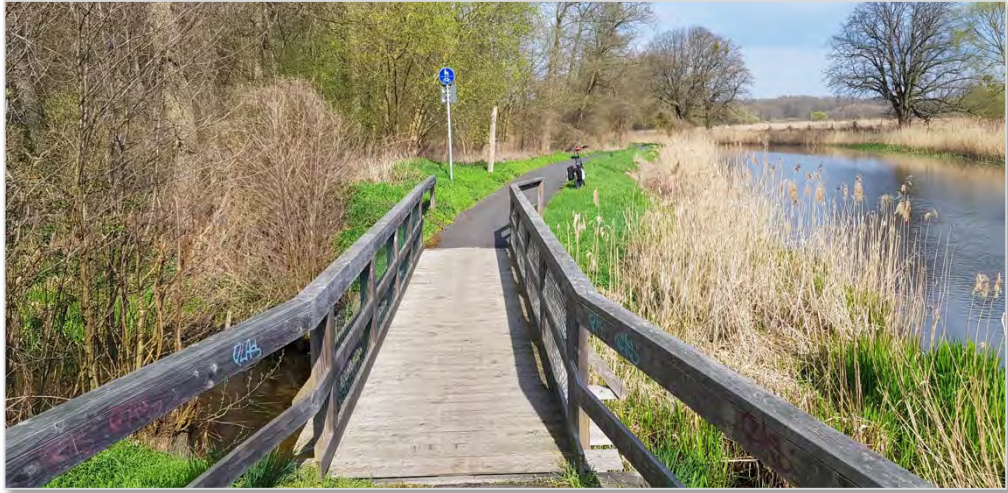
Abbildung 4: Am Oder-Havel-Radweg.