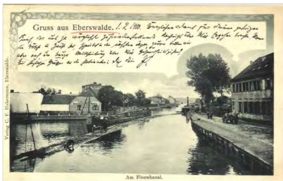
Abbildung 19: Floßzug bei der Einfahrt in die Schleuse Eberswalde. Aus: "Der Finowkanal aus der Sicht der Flößerei", Vortrag zum 6. Finowkanal-Symposium 2022

Die Bedeutung des Kanals für die Entwicklung der Industrie im Finowtal lässt sich am ehesten zwischen der Schleuse Schöpfungurth und dem Marina Park zeigen. In diesem „Erlebnisbereich Finowtal“ kann anhand zahlreicher noch vorhandener baulicher oder technischer Zeugnisse die Geschichte der vergangenen Jahrhunderte dargestellt werden. Diese kann dort nicht nur im Rahmen von organisierten Paddeltouren oder Sightseeing-Touren auf dem Wasser erläutert werden, sondern auch bei Touren zu Fuß oder per Rad. Der Verein Unser Finowkanal könnte seine umfangreiche Expertise dazu nutzen, entsprechende Angebote für Touren zu entwickeln und gegebenenfalls zusammen mit privaten Unternehmen anbieten.